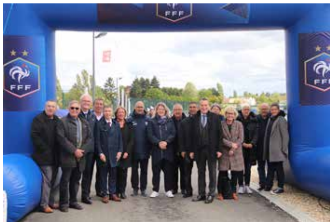
Centre Val de Loire