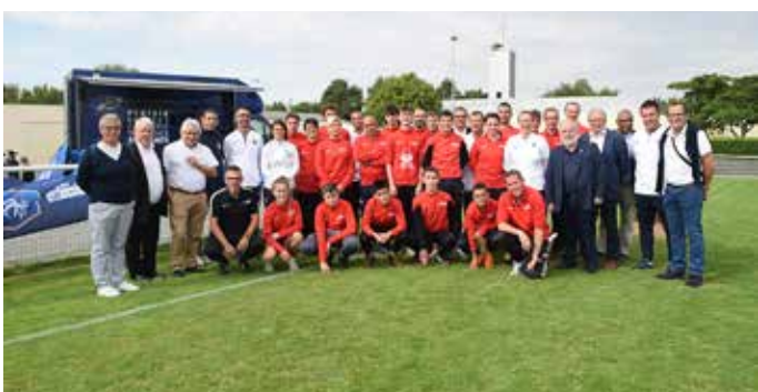
Pays de la Loire