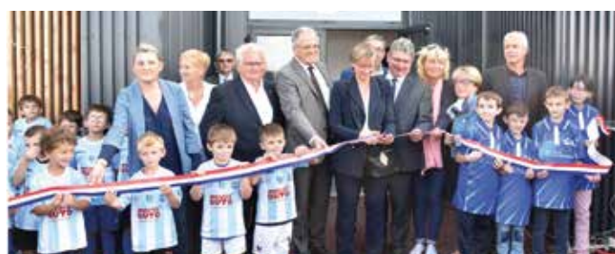
Auvergne Rhône Alpes