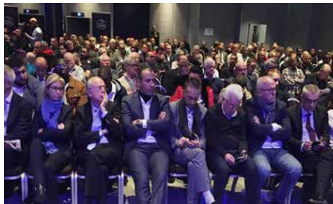
Paris Ile de France