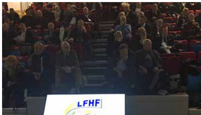
Haut de France